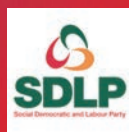
N. Ireland SDLP