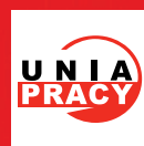
Poland UNIA PRACY